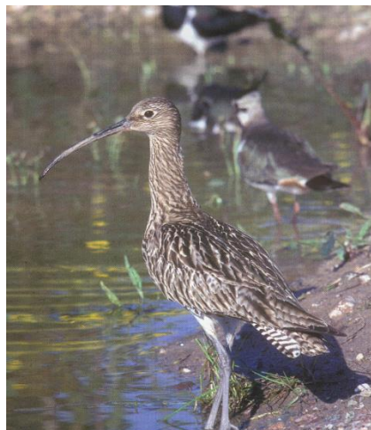
Le courlis cendré, porté disparu depuis 2 ans dans le Ried de la Bruche